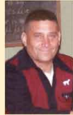
Alfa y Omega Enviado del Divino Padre Eterno, Autor de la Ciencia Celeste.-