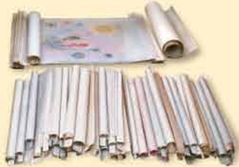
Los Rollos del Cordero de Dios (Apocalipsis 5)