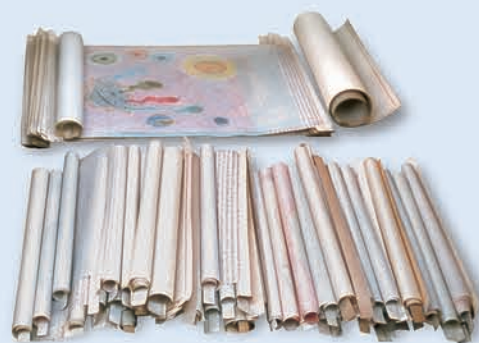
Los Rollos del Cordero de Dios (Apocalipsis 5)