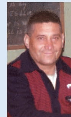
Alfa y Omega Enviado del Divino Padre Eterno, Autor de la Ciencia Celeste.-

Títulos de Rollos Telepáticos Tomo 6, del N° 3097 al 3696